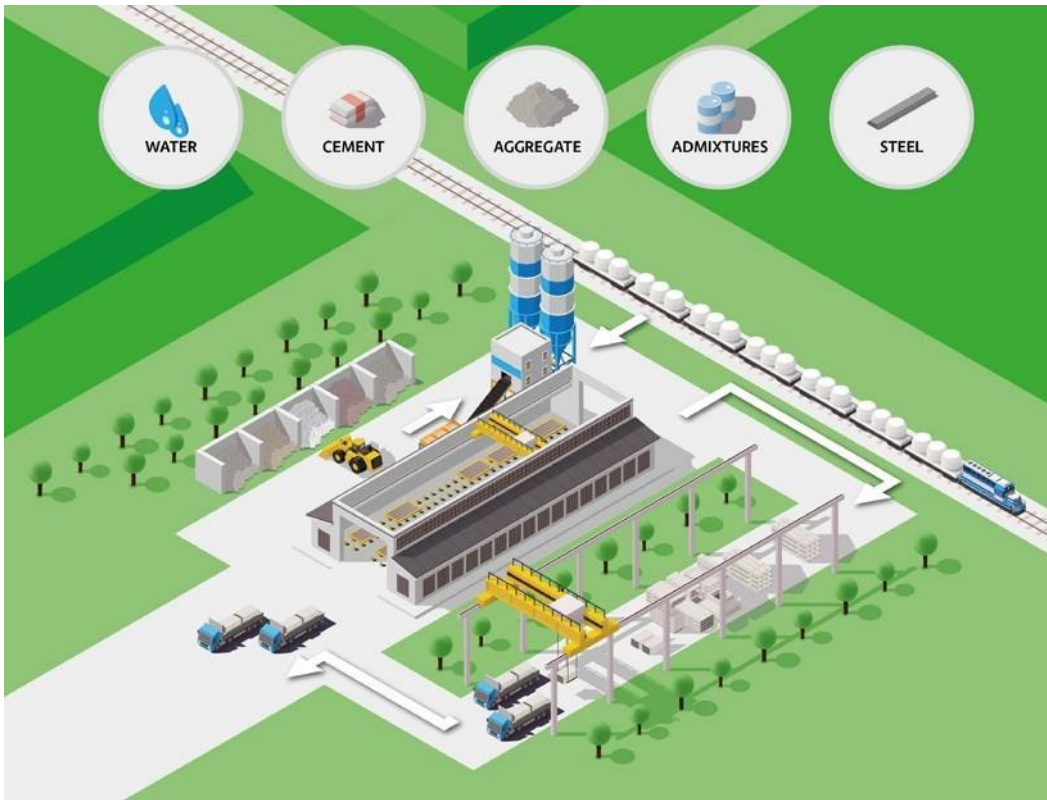
Schema der Herstellung der vorgefertigten Filigrandecken durch Pekabex BET S.A.