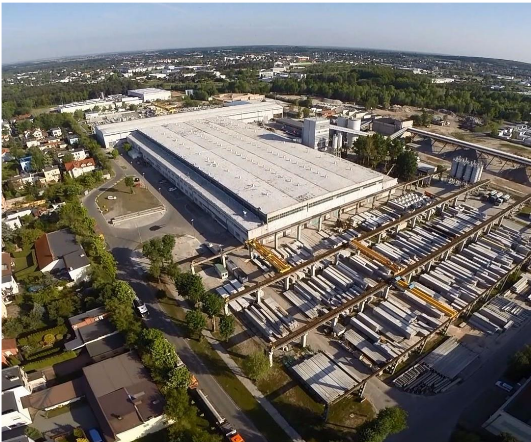
Abbildung 1. Eine Ansicht von Pekabex S.A. (Polen).

Das Unternehmen stellt traditionelle bewehrte Elemente sowie moderne vorgespannte Elemente her, die in geschlossenen Konstruktionen (z.B. Produktions- und Lagerhallen, Büros, Handelsobjekte, Bahnhöfe, Parkplätze), Ingenieurobjekten (z.B. Brücken, Tunnels) und atypischen Konstruktionen verwendet werden. Wir bieten eine breite Palette von Standardprodukten an und realisieren Sonderaufträge für individuelle Entwürfe. Pekabex S.A. verfügt über fünf Produktionsstätten in Poznań, Gdańsk, Bielsko-Biala, Mszczonów und Marktzeuln.